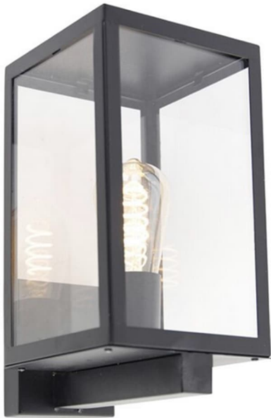
Wandarmatuur gevel t.p.v. begane grond en eerste verdieping ( nabij tuindeur volgens verkooptekening )