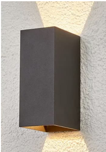
Wandarmatuur op balkons ( nabij balkondeur volgens verkooptekening )